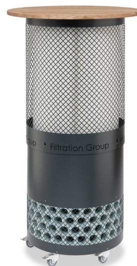
SilentCare Variante als Stehtisch